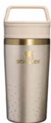
Alianza Stanley x Juan Valdez

Adicional, se consolidaron proyectos clave que refuerzan la fidelización y el posicionamiento de marca: