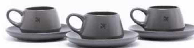
Vajilla en Cerámica (Set x4).