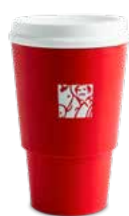
Renovación Vaso Reuso