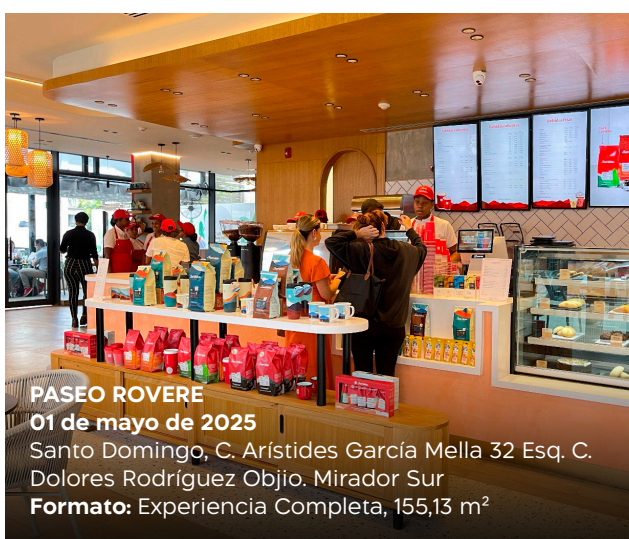
PASEO ROVERE 01 de mayo de 2025 Santo Domingo, C. Aristides García Mella 32 Esq. C. Dolores Rodríguez Obijo. Mirador Sur Formato: Experiencia Completa, 155,13 m²