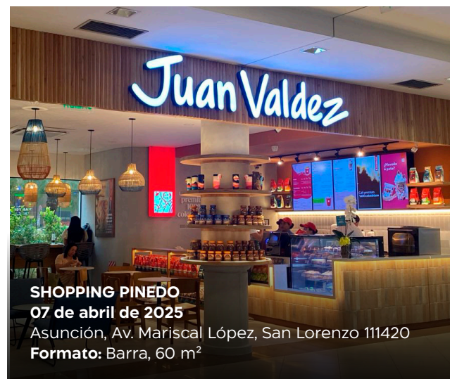
SHOPPING PINEDO 07 de abril de 2025 Asunción, Av. Mariscal López, San Lorenzo 111420 Formato: Barra, 60 m²

Juan Valdez® Café continúa su expansión en el mundo con la apertura de 13 tiendas nuevas durante el segundo trimestre de 2025, haciendo presencia en 21 países a cierre de junio.