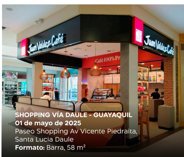
SHOPPING VÍA DAULE - GUAYAQUIL 01 de mayo de 2025 Paseo Shopping Av Vicente Piedraita, Santa Lucía Daule Formato: Barra, 58 m²