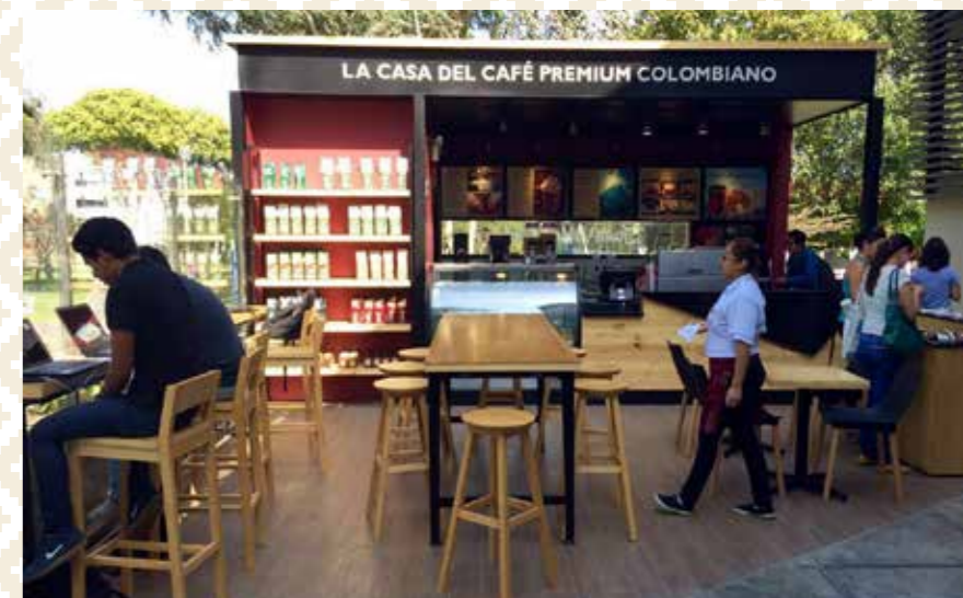
Universidad Catolica Lima - Peru.