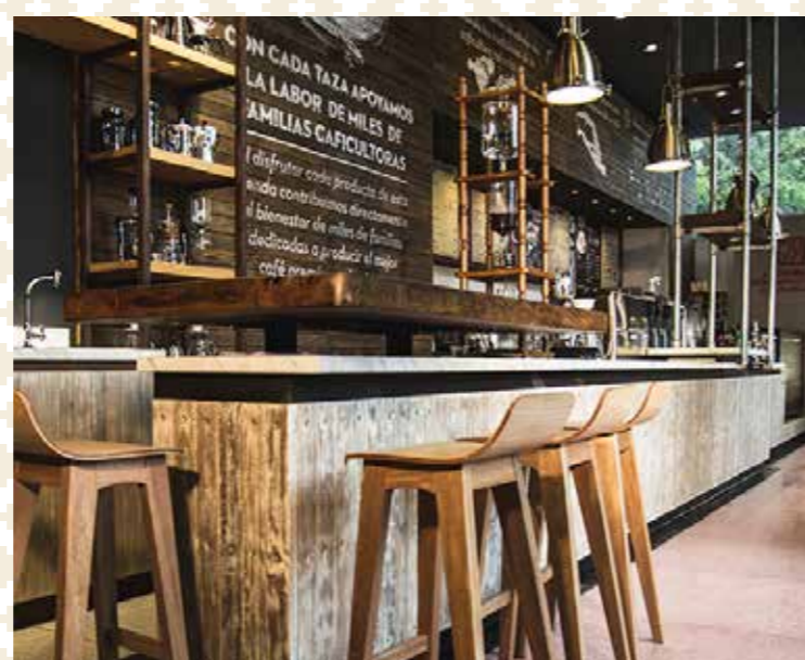
JW Marriot - Bogotá D.C.

Al cierre del primer trimestre de 2016 la ganancia neta o utilidad neta procedente de la operación de Procafécol, registró una cifra de $1.811 millones de pesos, superior en un 82% a los $997 millones de pesos obtenidos en el mismo periodo de 2015.