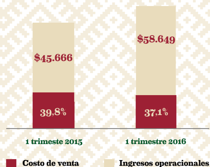
Grafica 2. Evolución porcentaje participación costo de venta

También es importante resaltar el apropiado control de los costos de venta, medido como su porcentaje de participación en los ingresos operacionales, que pasó de representar un 39,8% en el primer trimestre de 2015 a representar una participación de 37,1% en el primer trimestre del 2016.