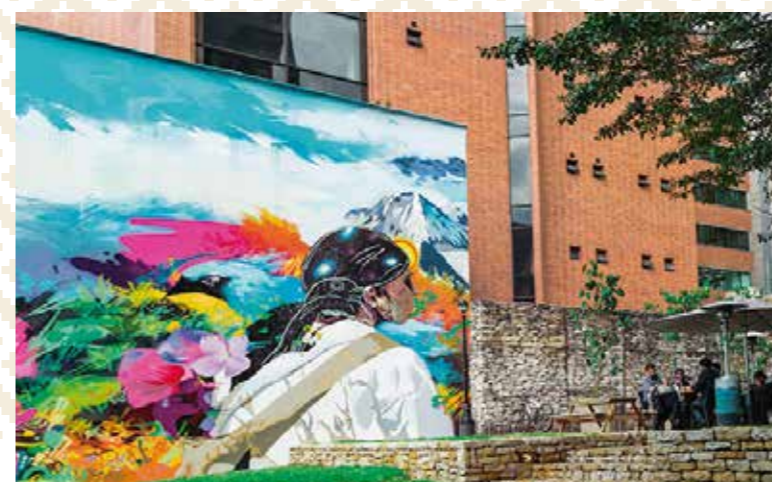
Mural tienda JW Marriot - Bogotá D.C.

Al finalizar el primer trimestre de 2016 Colombia cuenta 232 tiendas Juan Valdez® Café.