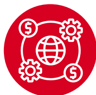
Delitos contra el sistema financiero