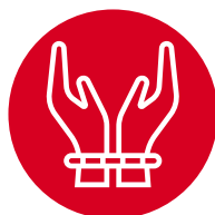
Trata de personas

Existen aproximadamente 65 delitos fuente de lavado de activos contemplados en el código penal, algunos de ellos son: