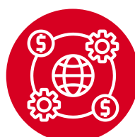
Crimes against the financial system