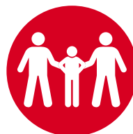
Trafficking of children and adolescents