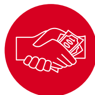
Enriquecimiento ilícito de particulares