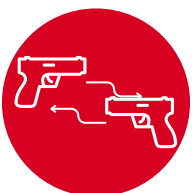
Tráfico de armas