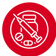
Tráfico de drogas, estupefacientes o sustancias psicotrópicas