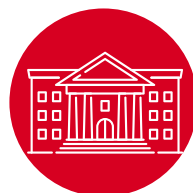
Delitos contra la administración pública